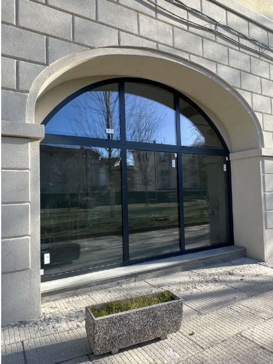
Nuovo infisso apertura ad arco, prospetto SUD