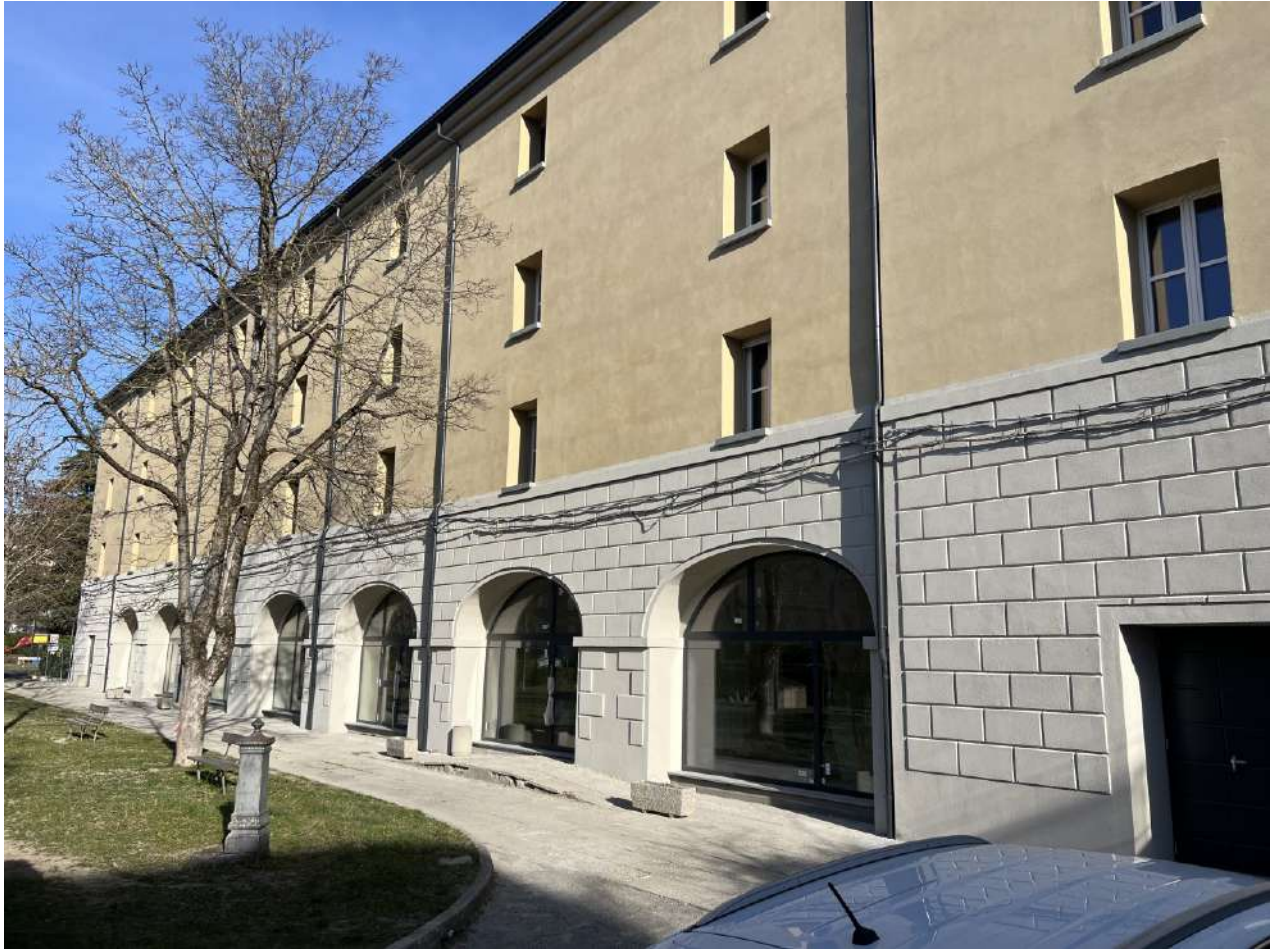
Prospetto SUD, vista da EST