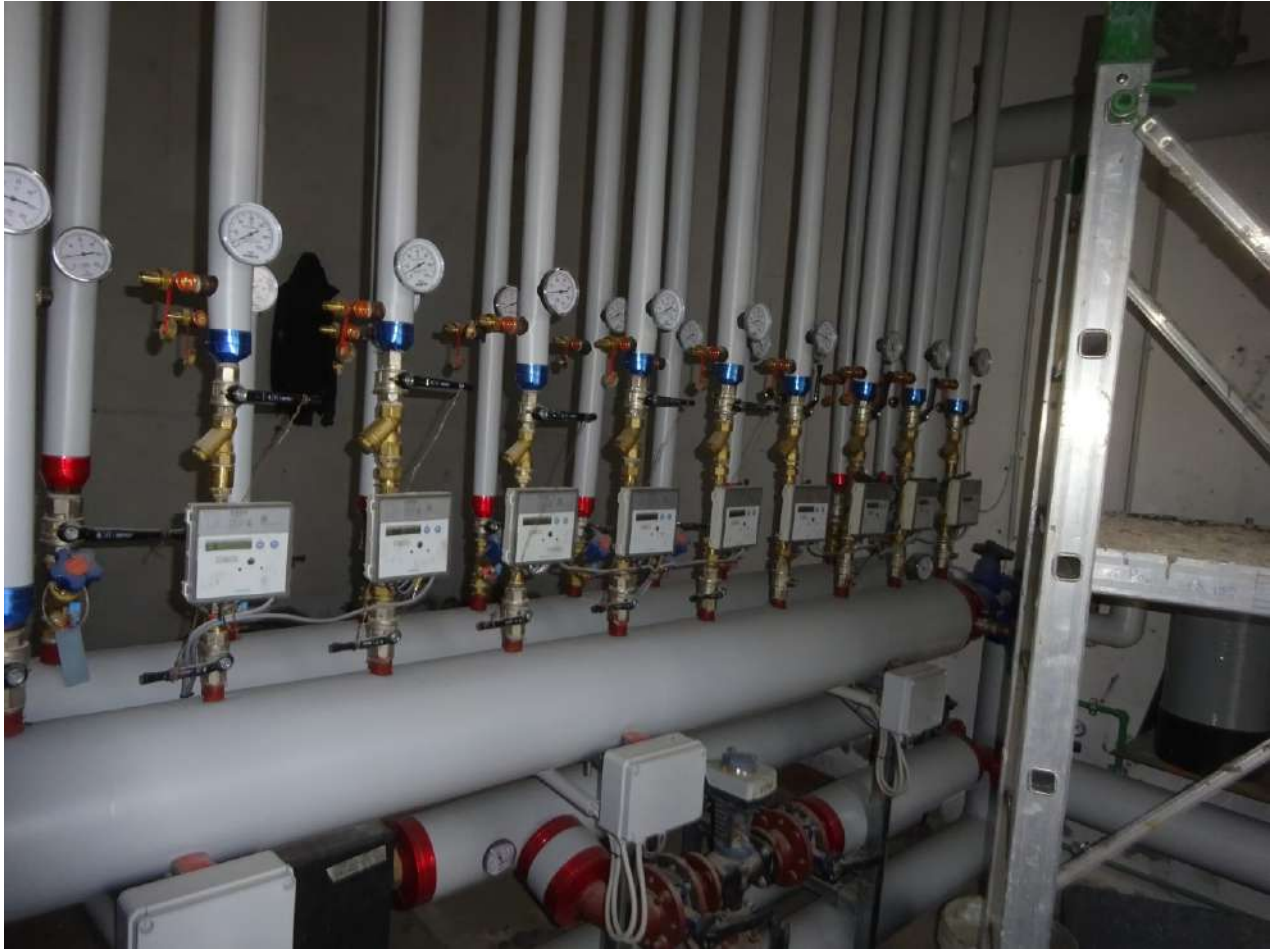
Centrale termica, piano terra