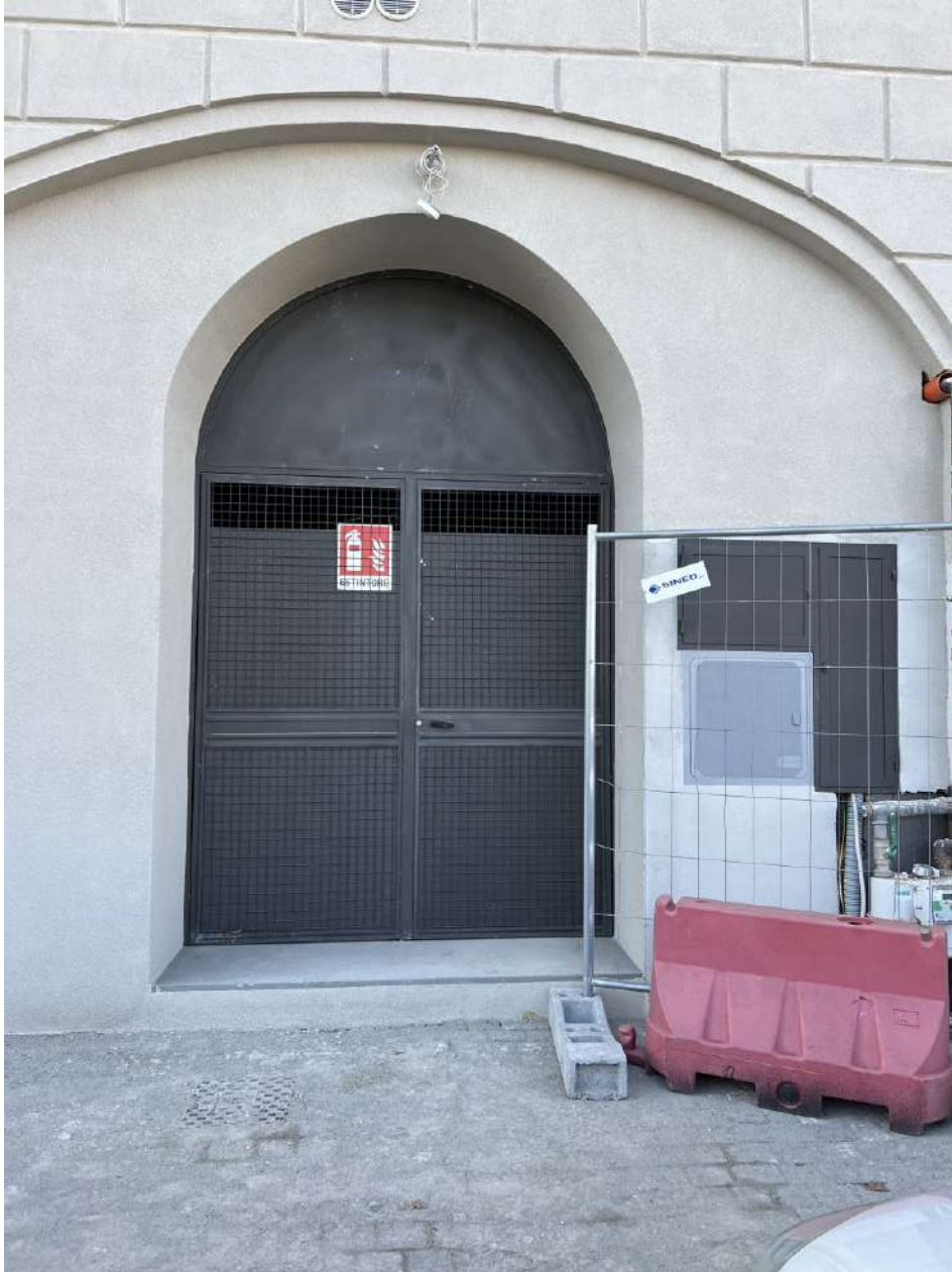
Prospetto NORD, ingresso centrale termica