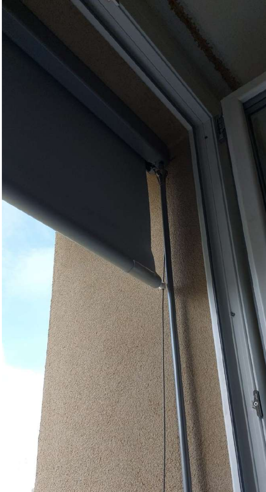
Prospetto SUD, dettaglio infisso