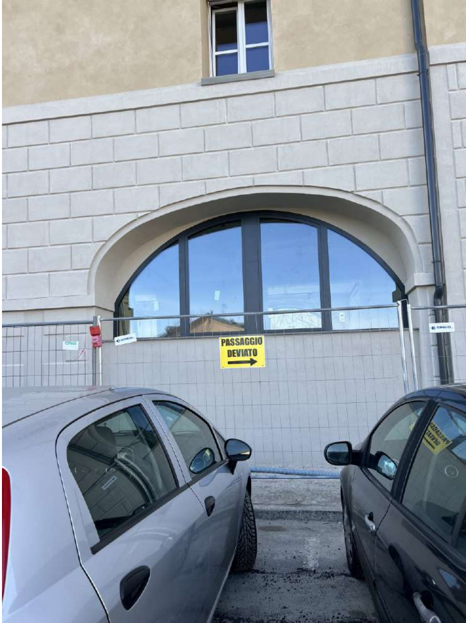
Nuovo infisso apertura ad arco, prospetto NORD