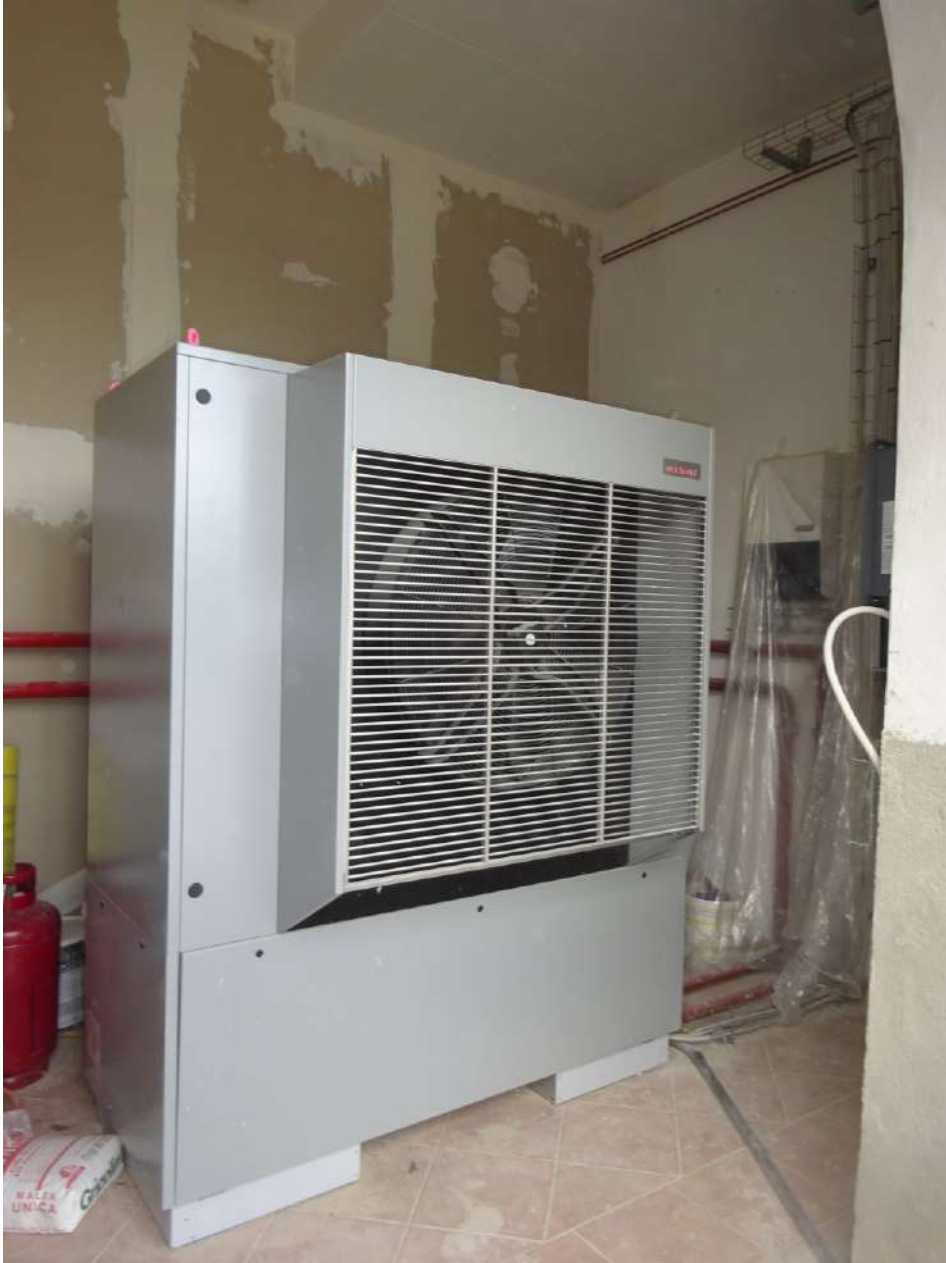
Centrale termica, piano terra