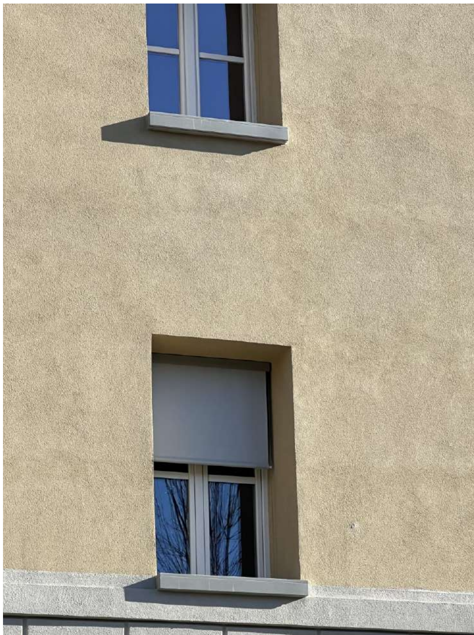
Nuovi infissi e tende oscuranti, prospetto SUD