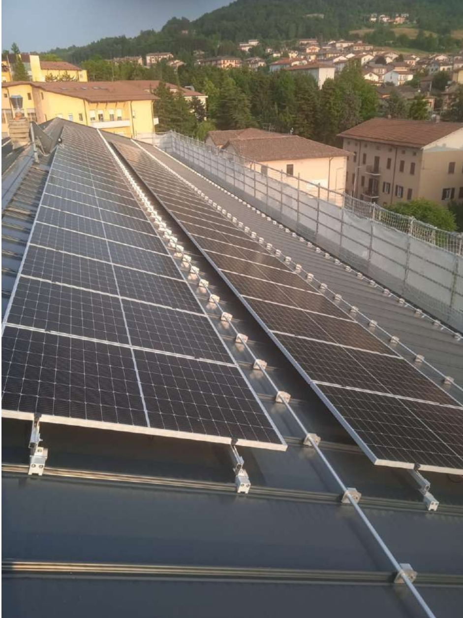
Pannelli fotovoltaici in copertura