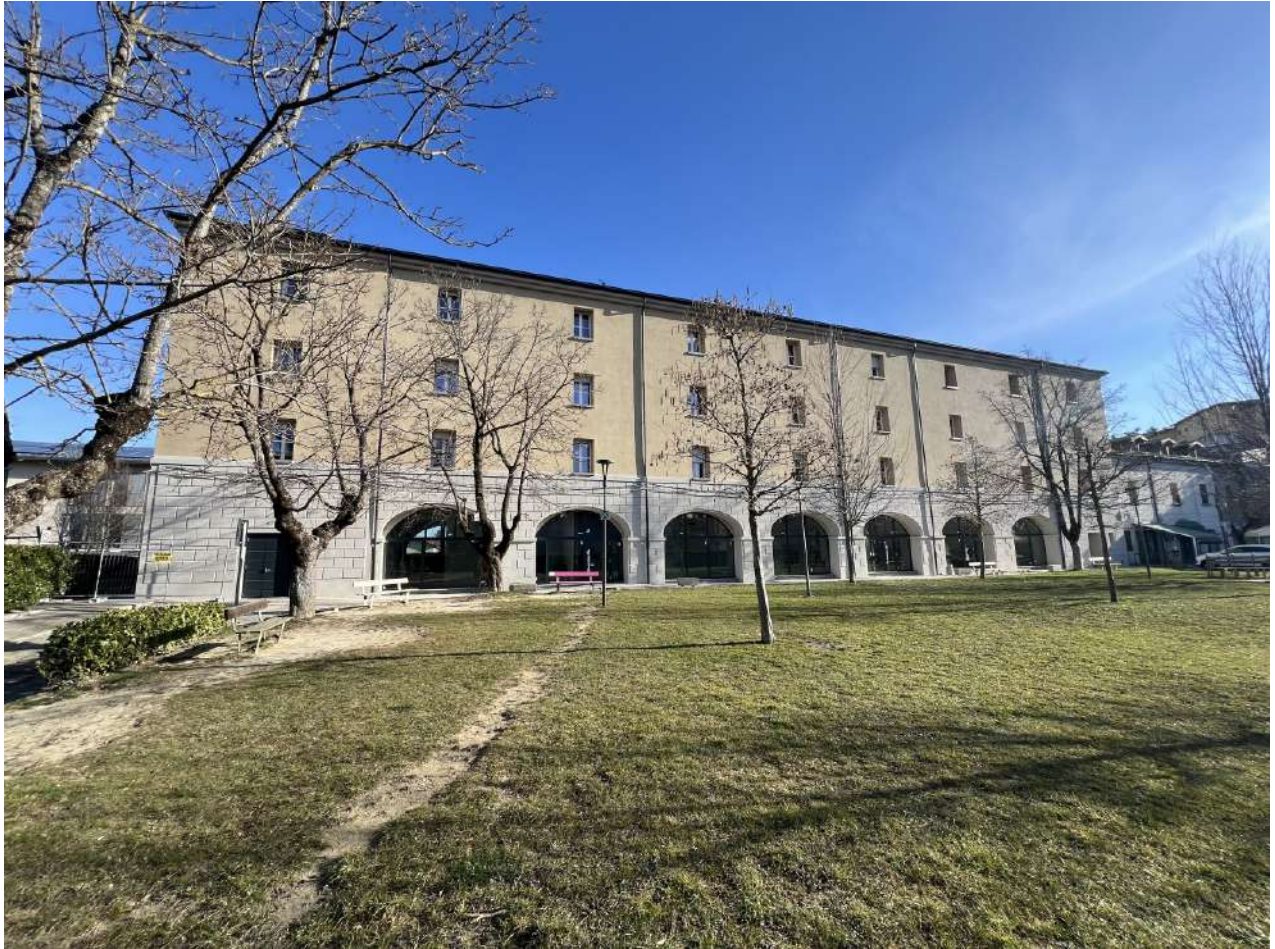
Prospetto SUD, vista frontale