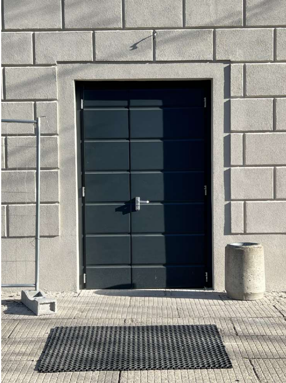
Portoncino di ingresso in legno, prospetto SUD