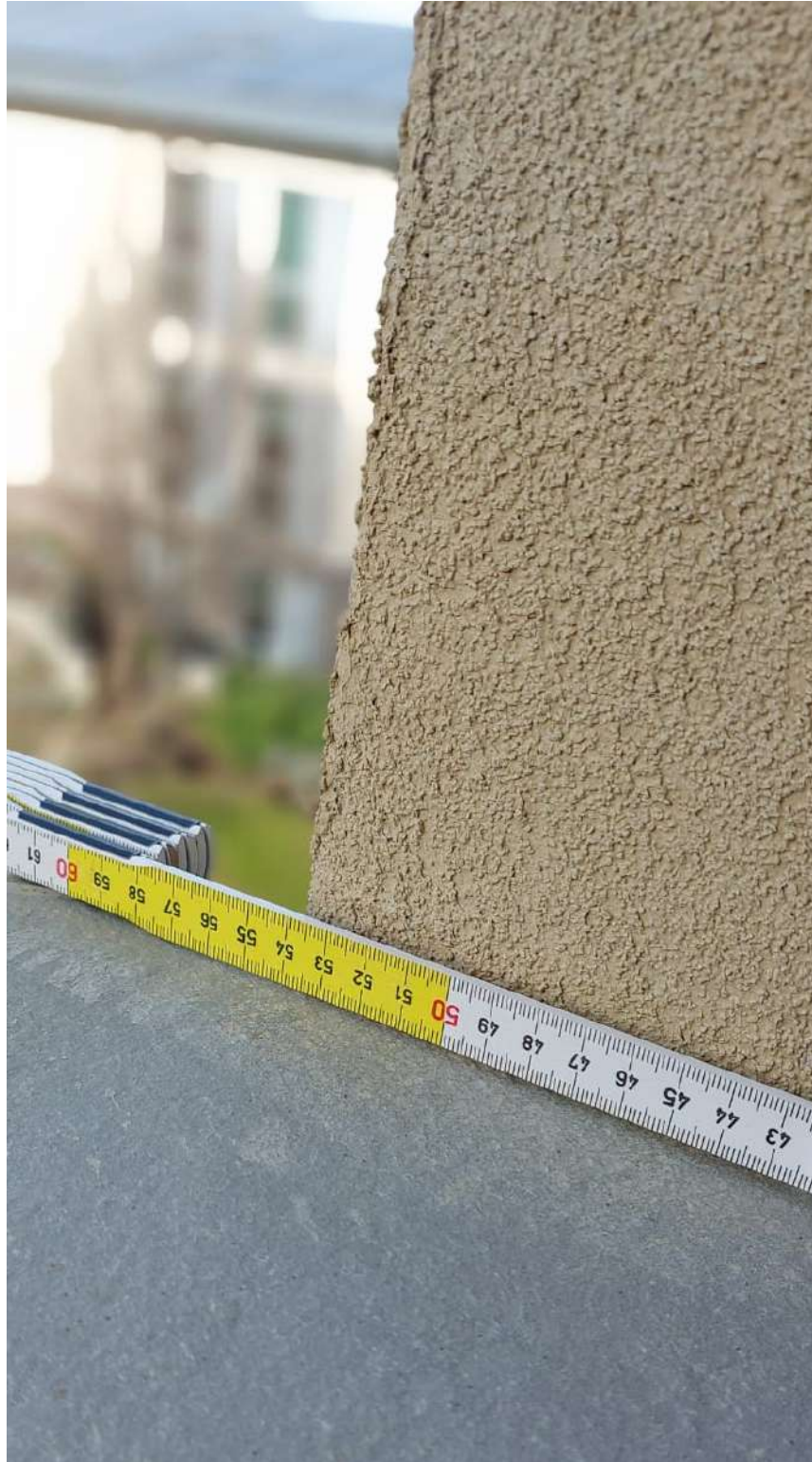
Prospetto SUD, dettaglio infisso e misurazione cappotto