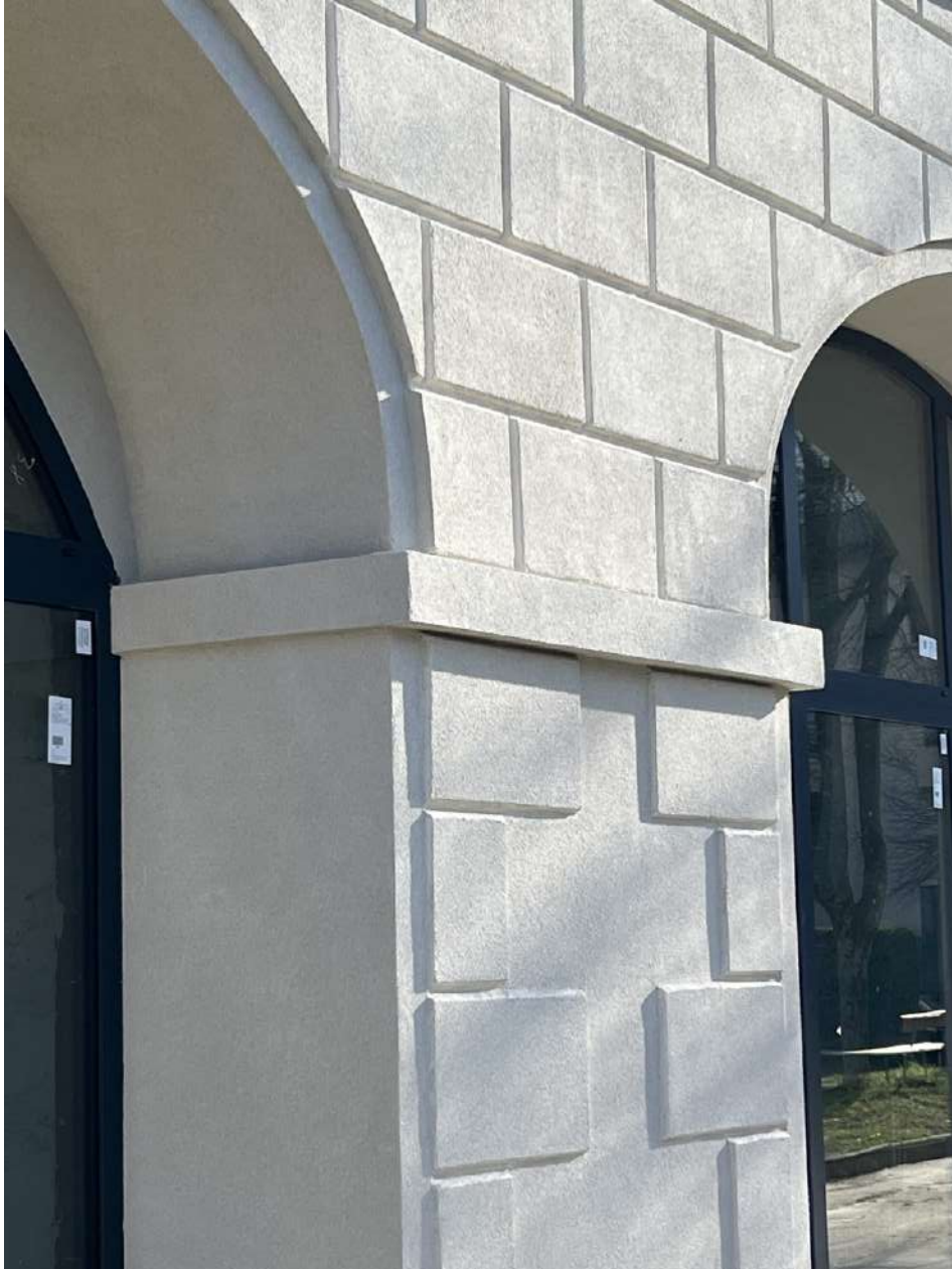
Realizzazione di conci a piano terra, prospetto SUD