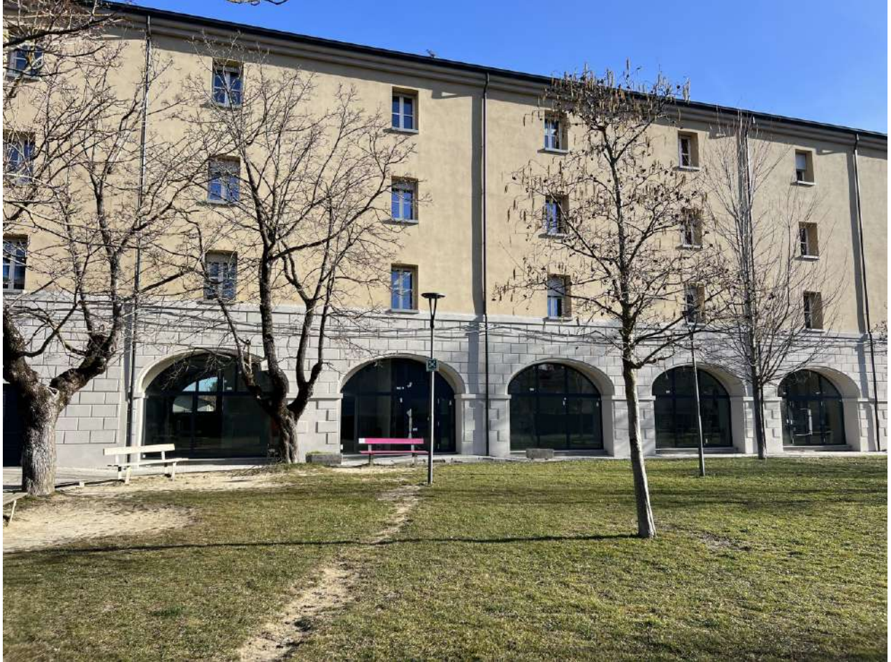
Prospetto SUD, vista frontale