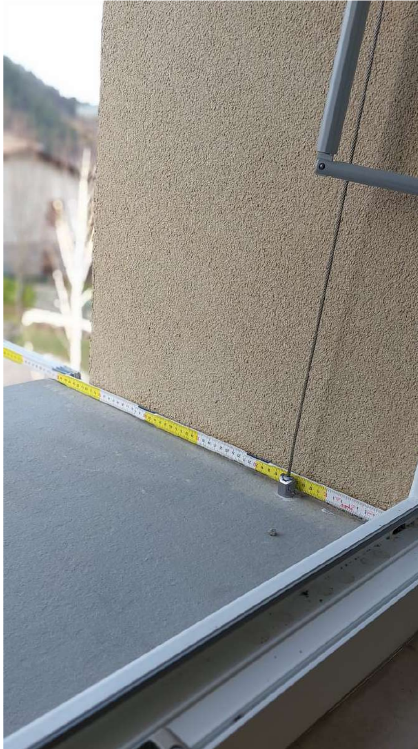
Prospetto SUD, dettaglio infisso e misurazione cappotto