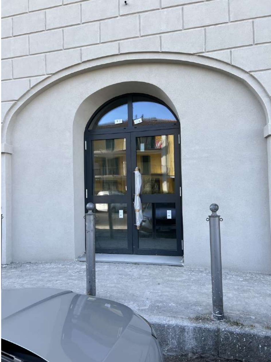
Prospetto NORD, apertura ad arco