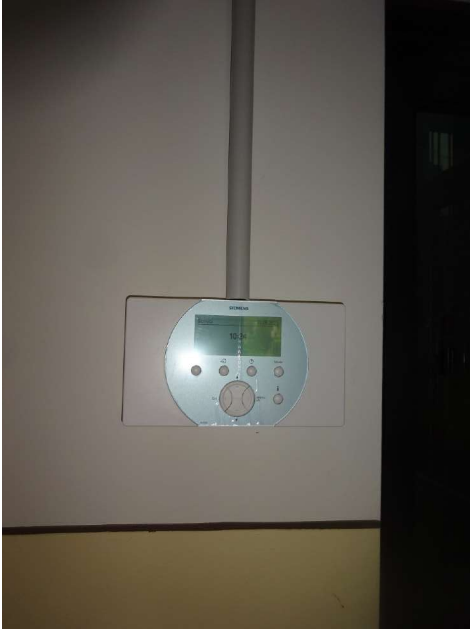
Centrale termica, piano terra