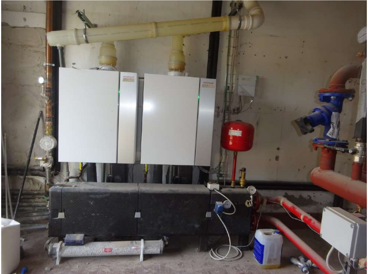
Centrale termica, piano terra