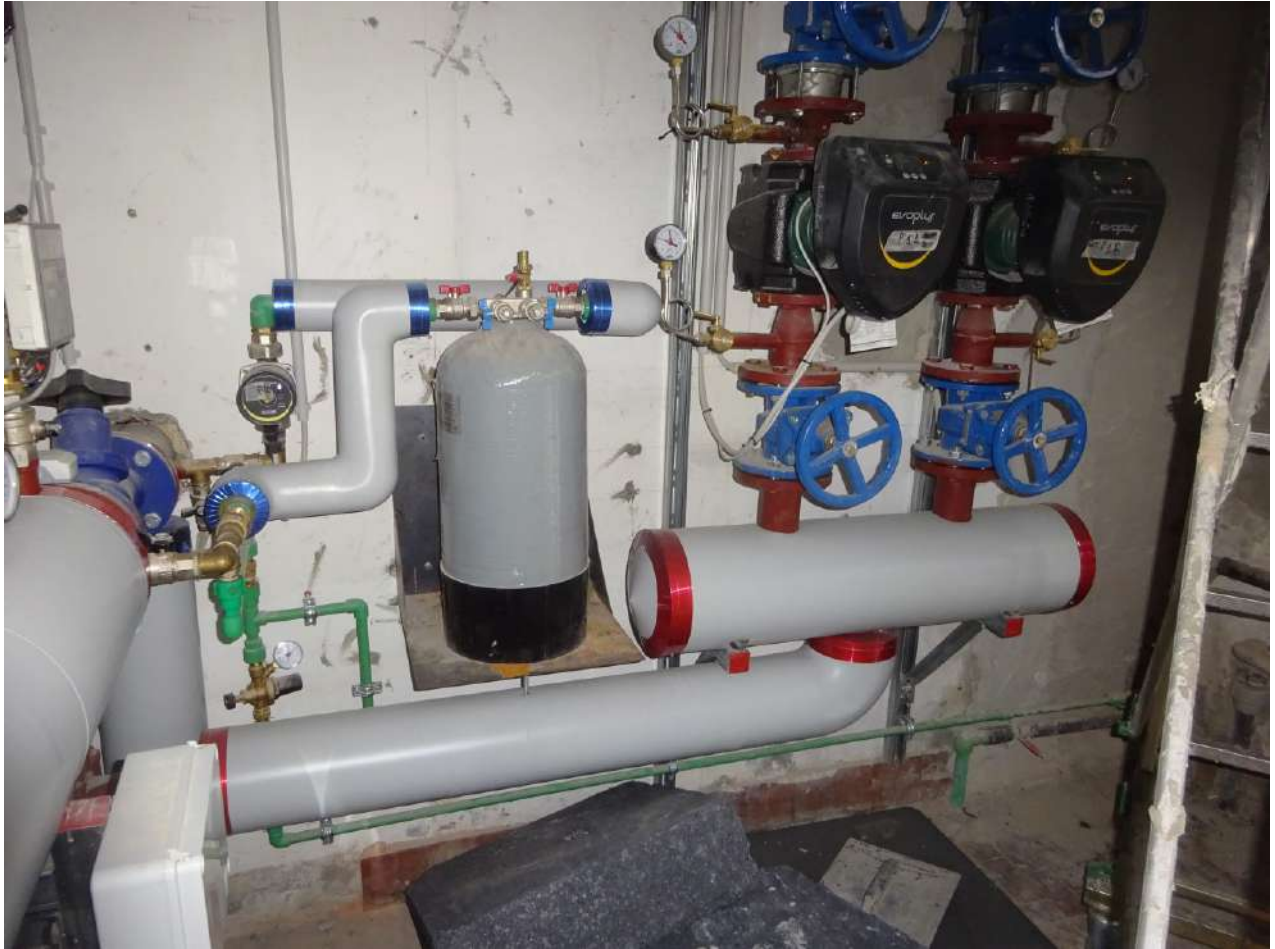
Centrale termica, piano terra