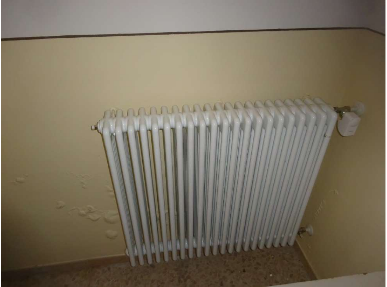
Installazione nuovo radiatore, piano terra