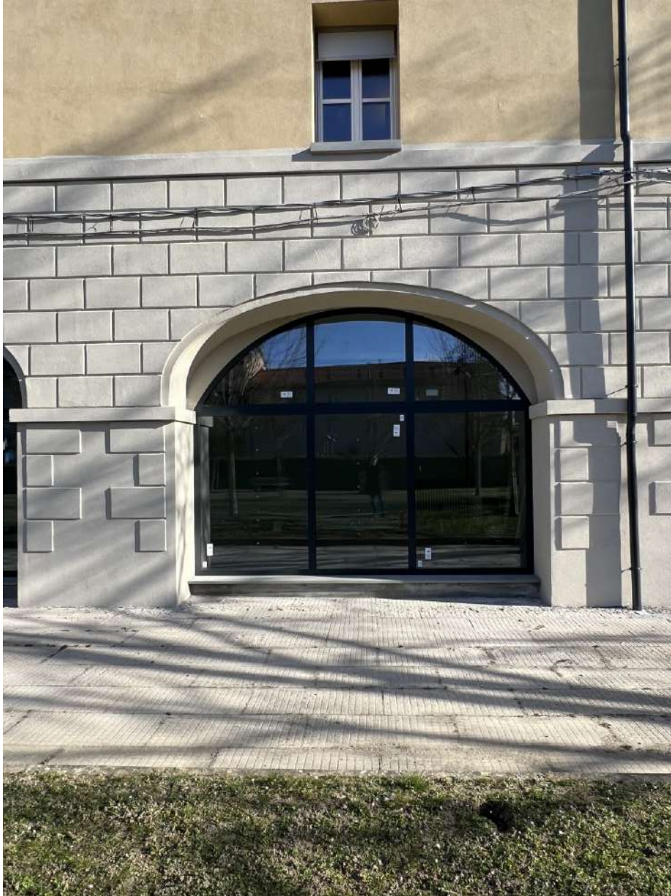
Nuovo infisso apertura ad arco, prospetto SUD