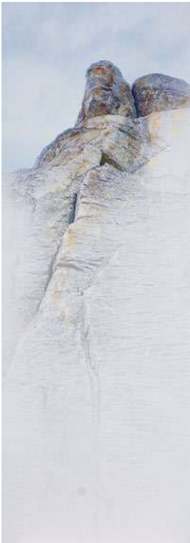
Opere di Fabio Adani

Il programma completo è a disposizione sul sito uomochecammina.it .