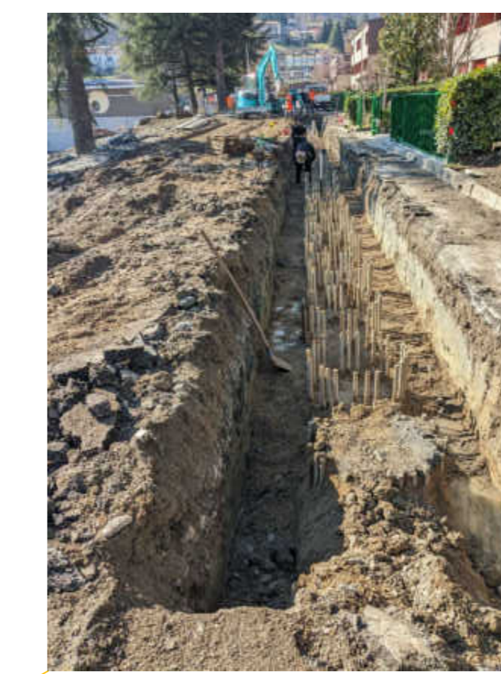
PALIFICATA (VEDI ELABORATI RELATIVI)