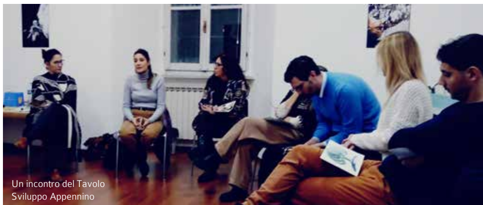
Un incontro del Tavolo Sviluppo Appennino

condividiamo con tanti territori e che ci richiama ad una grande responsabilità di portare ancora più attenzione alle nuove generazioni. Sappiamo che il Covid ha accelerato dei processi che erano già in corso e che questi processi possono essere gestiti e in certi casi invertiti. Per farlo dobbiamo essere consapevoli che servono anni di azioni dedicate e una visione politica coraggiosa, non servono a niente azioni spot e focalizzate solo sulle emergenze. Ho anche osservato che i giovani sono ancora desiderosi di partecipare, di dire la loro, di essere coinvolti in azioni per migliorare il posto in cui vivono, di tutelare l'ambiente, hanno idee creative che fatichiamo a vedere nella loro grande capacità innovativa e di impatto. Abbiamo il dovere e la necessità di ascoltarli di più, di prenderli molto sul serio, di tenerci strette le loro proposte".