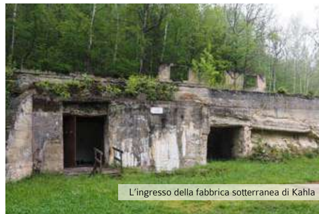
L'ingresso della fabbrica sotterranea di Kahla

A Kahla negli ultimi anni della seconda guerra mondiale furono costretti al lavoro coatto migliaia di prigionieri italiani, belgi, francesi, olandesi, russi e polacchi rastrellati e deportati, che dovevano costruire, all'interno di tunnel sotterranei, i moderni caccia a reazione Messerschmitt 262. Circa 15.000 di loro morirono a causa delle malattie e delle terribili condizioni di vita. Qui finirono anche numerosi castelnovesi e montanari, rastrellati e imprigionati al Teatro Bismantova nel 1944 prima di essere avviati alla deportazione. Una lapide posta al cimitero di Kahla ricorda i prigionieri di Castelnovo che morirono