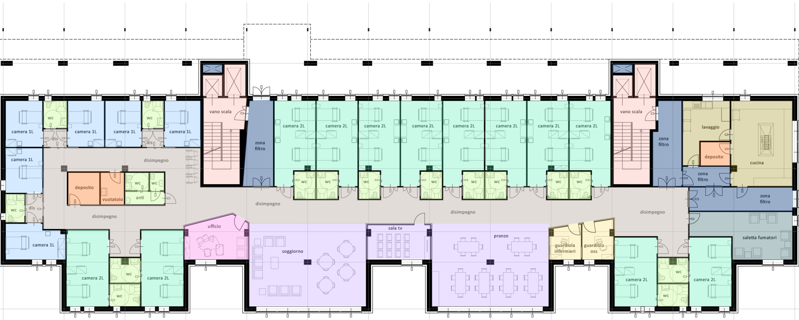
pianta piano terra