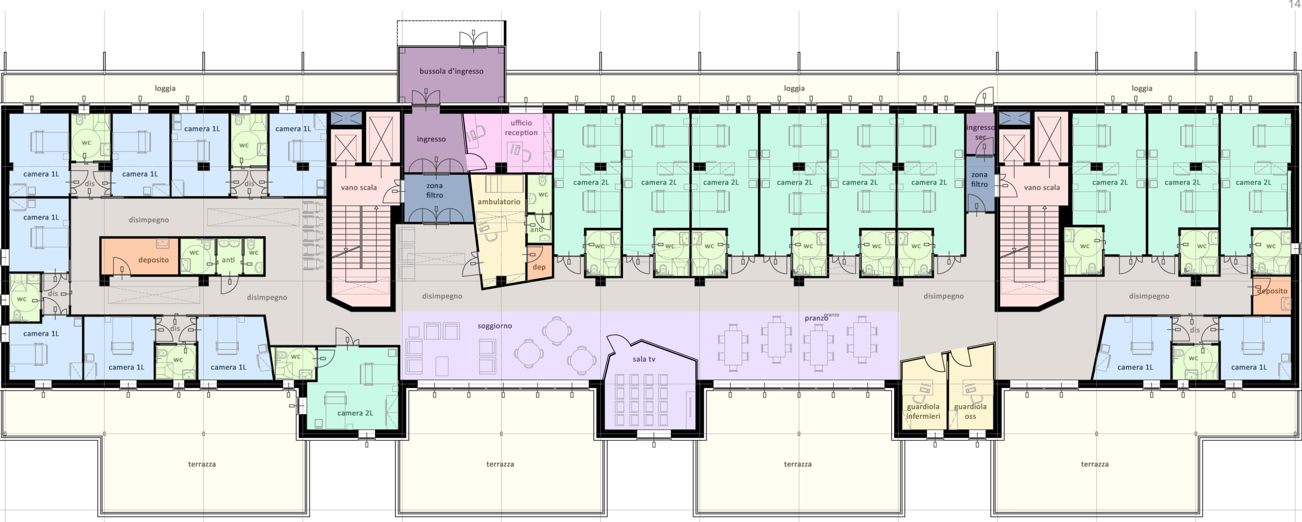
pianta piano primo