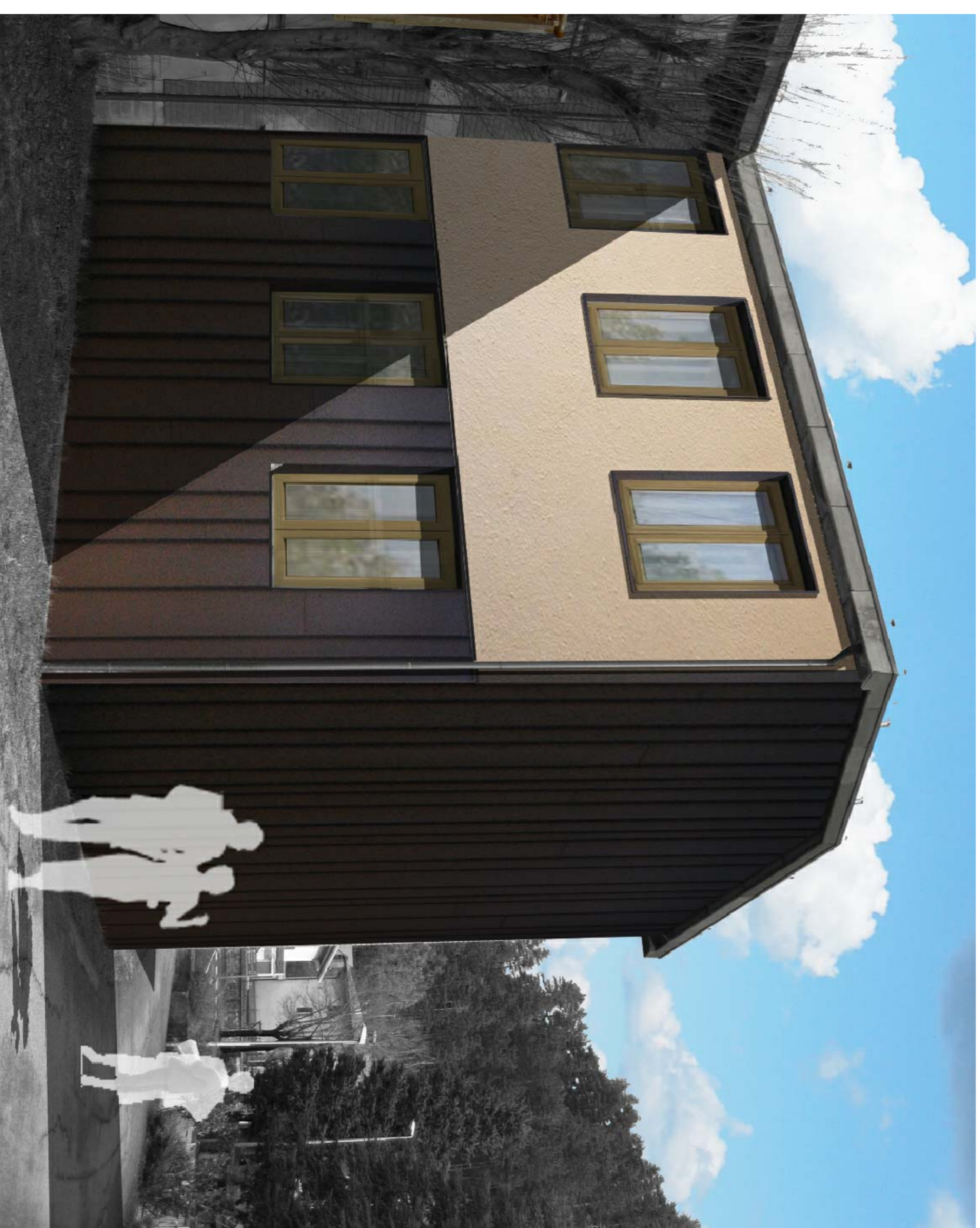
vista fotorealistica zona Aule