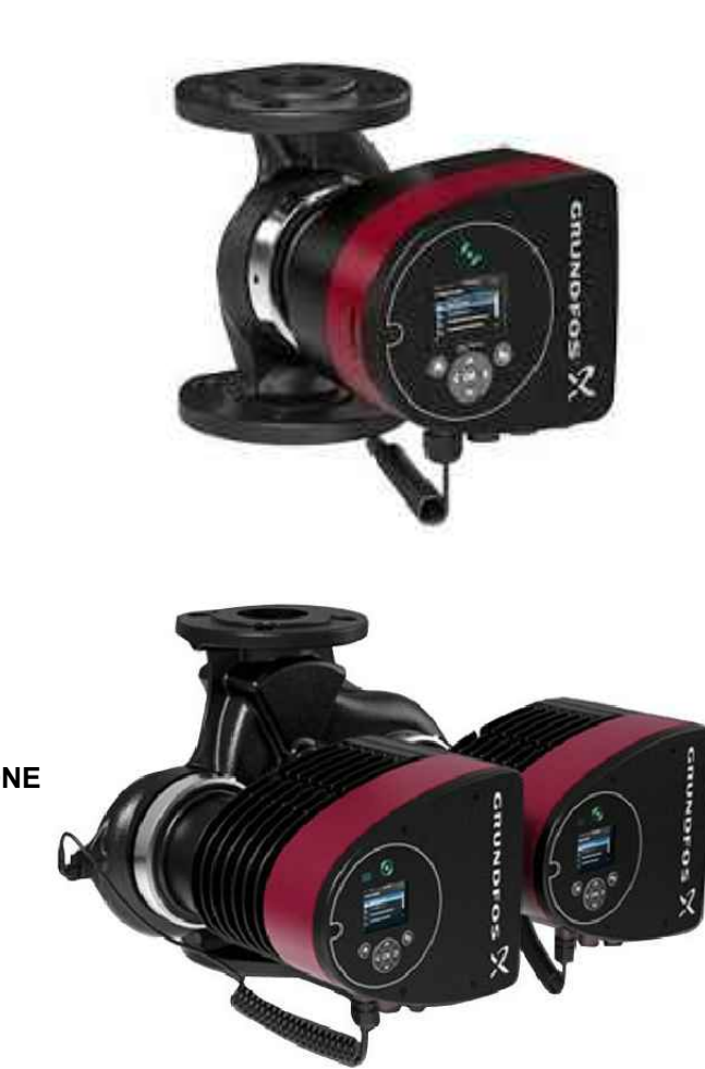
3.b - PARTICOLARE POMPE OGGETTO DI SOSTITUZIONE MODELLO TIPO GRUNDFOS SERIE MAGNA 3