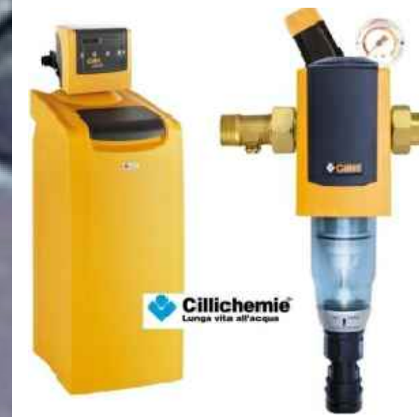
3.a - PARTICOLARE ADDOLCITORE OGGETTO DI INSTALLAZIONE MODELLO TIPO CILICHEMIE