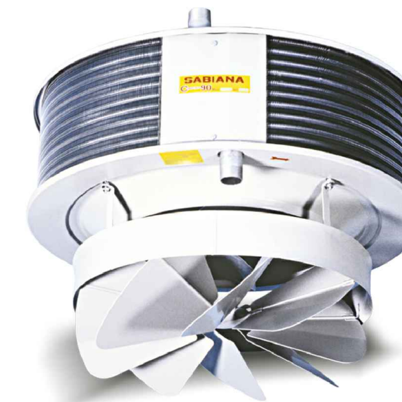
1.a - PARTICOLARE AEROTERMO OGGETTO DI SOSTITUZIONE MODELLO TIPO SABIANA SERIE COMFORT 6

Aerotermi oggetto di futura sostituzione con nuovi corpi