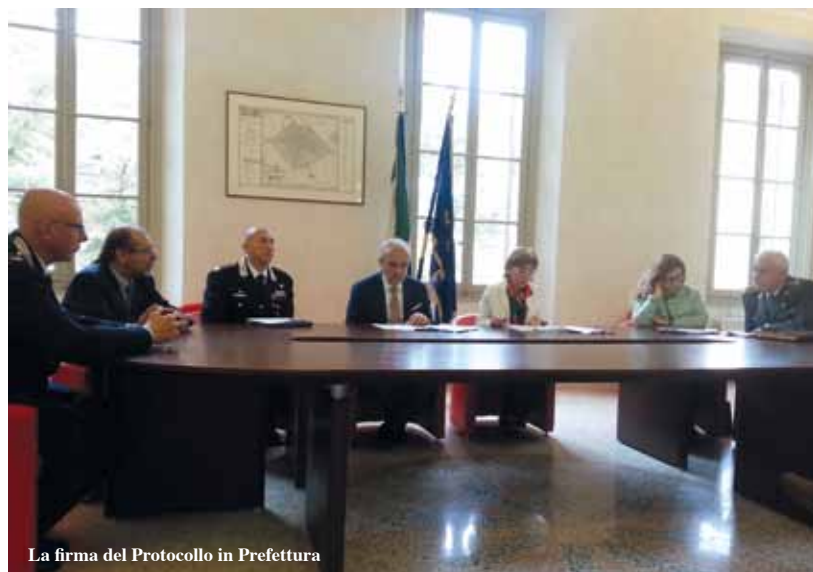
La firma del Protocollo in Prefettura