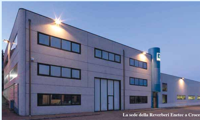
La sede della Reverberi Enetec a Croce

La nostra presenza forte all'estero è stata resa possibile grazie ad una importante rete di partner costruita negli anni. E' fondamentale poter contare su partner affidabili, e per questo una grossa parte del lavoro sta proprio nella costruzione e nel mantenimento di questa rete. Il lavoro all'estero oggi è incentrato soprattutto sulla divulgazione del concetto di risparmio energetico: oggi in Italia è diventato la norma, ma ci sono paesi in cui andare a spiegare che si può risparmiare fino al 50% sui consumi elettrici per una pubblica amministrazione, trova ancora una certa incredulità e diffidenza. Poi però se si fidano si rendono conto che i risultati arrivano davvero”. Oggi la Reverberi Enetec conta 40 dipendenti, dei quali quasi 30 dell'Appennino. All'indotto diretto legato alla produzione, va ricondotto quello derivante dalle visite costanti di clienti e partner che si riflette su alberghi e ristoranti. Una realtà di pregio che porta il nome di Castelnuovo nel mondo.