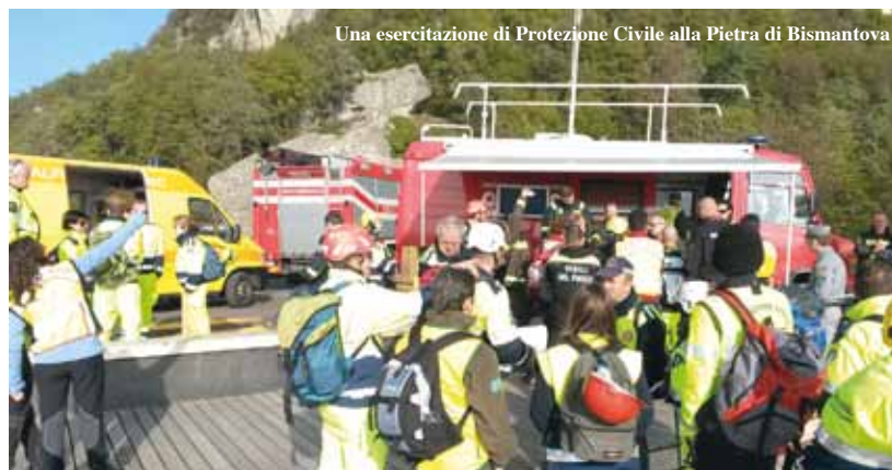
Una esercitazione di Protezione Civile alla Pietra di Bismantova