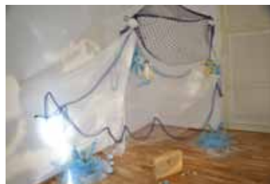
luogo, quel lavoro lì, il nuovo Nido.

Poi è passato del tempo e senza quasi che me n'accorgessi è arrivato l'autunno e il nuovo Nido era davvero finito e i bambini avevano iniziato ad abitarlo, ma io non c'ero più tornato. Con l'autunno abbiamo anche ripreso a girare per le frazioni del Comune e andavamo a presentare il bilancio e ascoltavamo la gente che ci faceva un sacco di domande ed era davvero bello poter provare a rispondere. Così una sera è capitata una domanda anche sul nuovo Nido e questa domanda pressapoco suonava così: ma che cos'è quel lavoro lì? E io quella sera ho anche provato a rispondere, ho provato a spiegarlo, quel lavoro lì, ma mentre lo spiegavo mi accorgevo che non sarebbe servito a niente, mi accorgevo che spiegando stavo tradendo quel