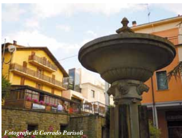
Fotografie di Corrado Parisoli