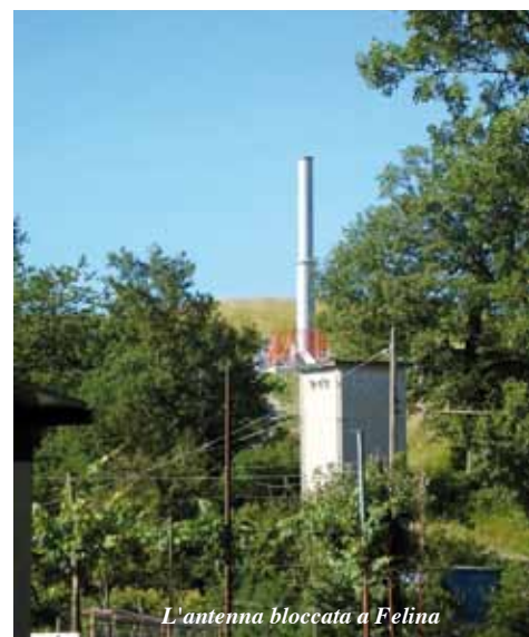
L'antenna bloccata a Felina

La realizzazione di un piano di localizzazione delle antenne ci pone poi all'avanguardia nel territorio montano: siamo l'unico Comune che al momento vi stia lavorando, e questo ci darà in futuro uno strumento forte per poter influire sulla scelta di installare nuovi impianti. Sarà infatti un piano che