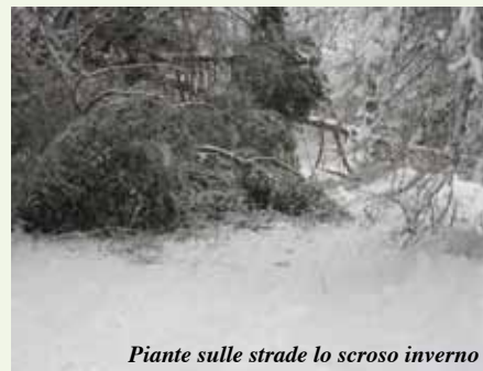
Piante sulle strade lo scorso inverno

E' stata rinnovata l'Ordinanza che impone ai proprietari di terreni confinanti con le strade comunali, di provvedere al taglio ed alla potatura di alberi e ramaglie. Una abitudine che in passato era diffusa e costante nei proprietari di appezzamenti e terreni, che oggi invece viene praticata con sempre minor frequenza, e che causa problemi e danni non di poco conto. Lo scorso inverno ad esempio sono stati necessari moltissimi interventi d'urgenza per liberare le strade da rami o piante cadute, per il peso della neve accumulata, causando spesso code e blocchi