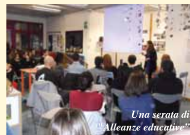
Una serata di “Alleanze educative”