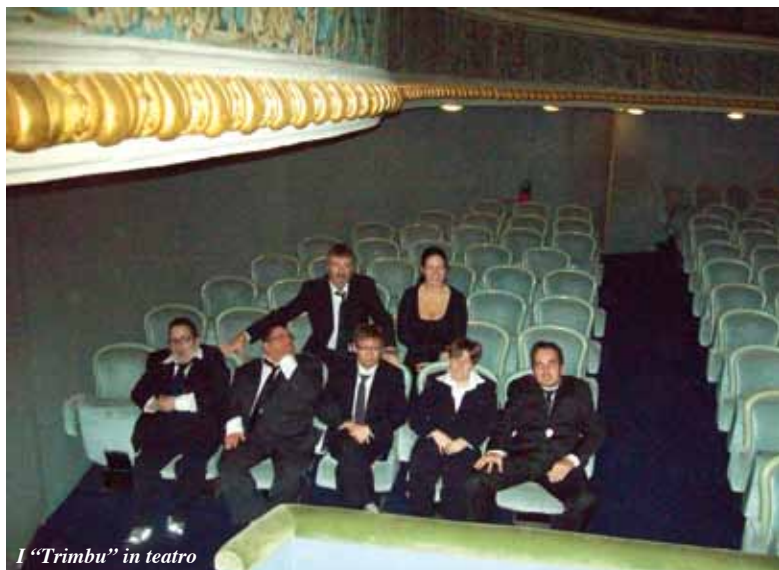
I "Trimbu" in teatro

Hanno trascorso una settimana trionfale in Francia, grazie al grande successo riscosso in un festival di portata internazionale, poi replicato con la proiezione al Teatro Bismantova di quella strabiliante performance, ad inizio dicembre: sono i Trimbu, un gruppo musicale originalissimo dell'Appennino reggiano. Si tratta infatti di un gruppo composto da giovanissimi ragazzi disabili, che da alcuni anni portano avanti questo progetto avviato dal Peri Merulo di Castelnovo, e che vede la collaborazione di una importante realtà francese attiva da 30 anni, le Percussions de Treffort, fondate nel 1979 da Alain Goudard, gruppo di musicisti semi professionisti, tutti disabili, che ha anche numerosi progetti dedicati ai più giovani che si avviano allo studio musicale. La collaborazione tra l'Istituto musicale castelnovese e questa grande realtà d'oltralpe partì nel 2010, ed in novembre ha vissuto il suo momento più alto finora. La manifestazione a cui i Trimbu hanno partecipato era l'Orphee Festival - Festival Européen Théâtre & Handicap, il principale in Europa dedicato al rapporto tra musica e disabilità. Ed i ragazzi dell'Appennino si sono esibiti insieme alle Percussions de Treffort nello spettacolo Bruits de Couloir ("rumori di corridoio"), sia con l'esecuzione di un brano che hanno studiato e preparato nei mesi scorsi, che partecipando agli altri