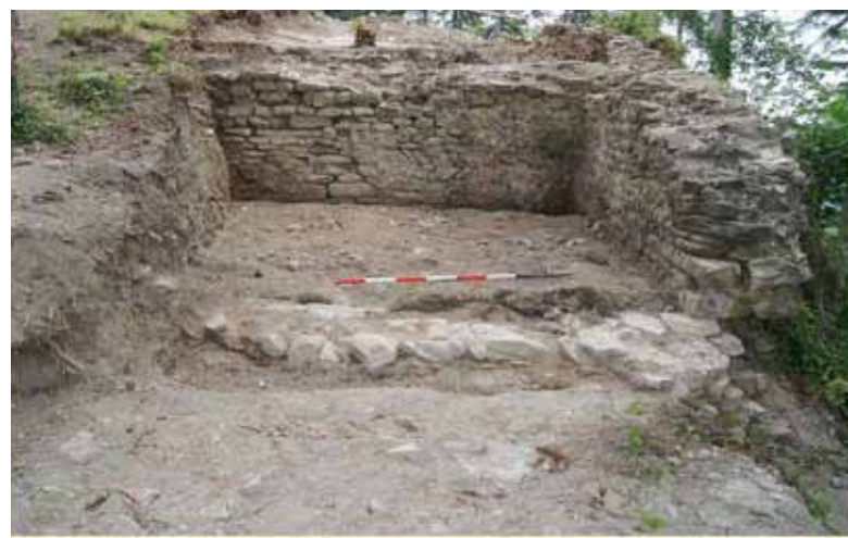
Saggio 3 - Ambiente rettangolare 3x5m

mento Baricchi spiega tra l'altro: "La fondazione di questa rocca si deve all'attività di incastellamento della montagna reggiana attuata dalla famiglia di Matilde di Canossa, ed edificata su questo monte a controllo della via di comunicazione con la Toscana tramite il Passo di Pradarena. Dall'epoca dell'abbandono del castello, avvenuto intorno al XVII secolo, si segnalano numerosi episodi di crollo. Siamo di fronte ad un esempio di piccolo castello a recinto, edificato alla sommità di un pianoro, regolarizzato artificialmente allo scopo. All'estremità nord e a quella sud sono due torri di vedetta. La torre sud è apparentemente quella di primo impianto: a pianta circolare è edificata scavando la roccia (marna) naturale per inserire nella cavità interna la fondazione della struttura. La torre nord, con-