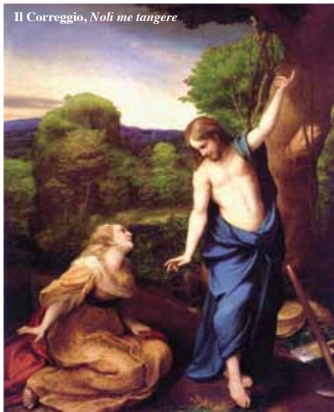
Il Correggio, Noli me tangere

nata in cui Gonzalez ha esplorato il territorio, cercando un punto di vista dal quale Bismantova assomigliasse il più possibile al dipinto. E alla fine, lo scorcio più simile è risultato quello che è possibile vedere dal monte sul quale sorge l'abitato di Pietradura, borgo a sua volta molto antico, verso il quale la Pietra offre il suo lato degradante e coperto di vegetazione, come nel dipinto. E da cui, nella medesima posizione in cui il Correggio posiziona un campanile, si vede ancora oggi la Pieve di Campiliola, già in quel periodo tra i più importanti luoghi di culto dell'Appennino.