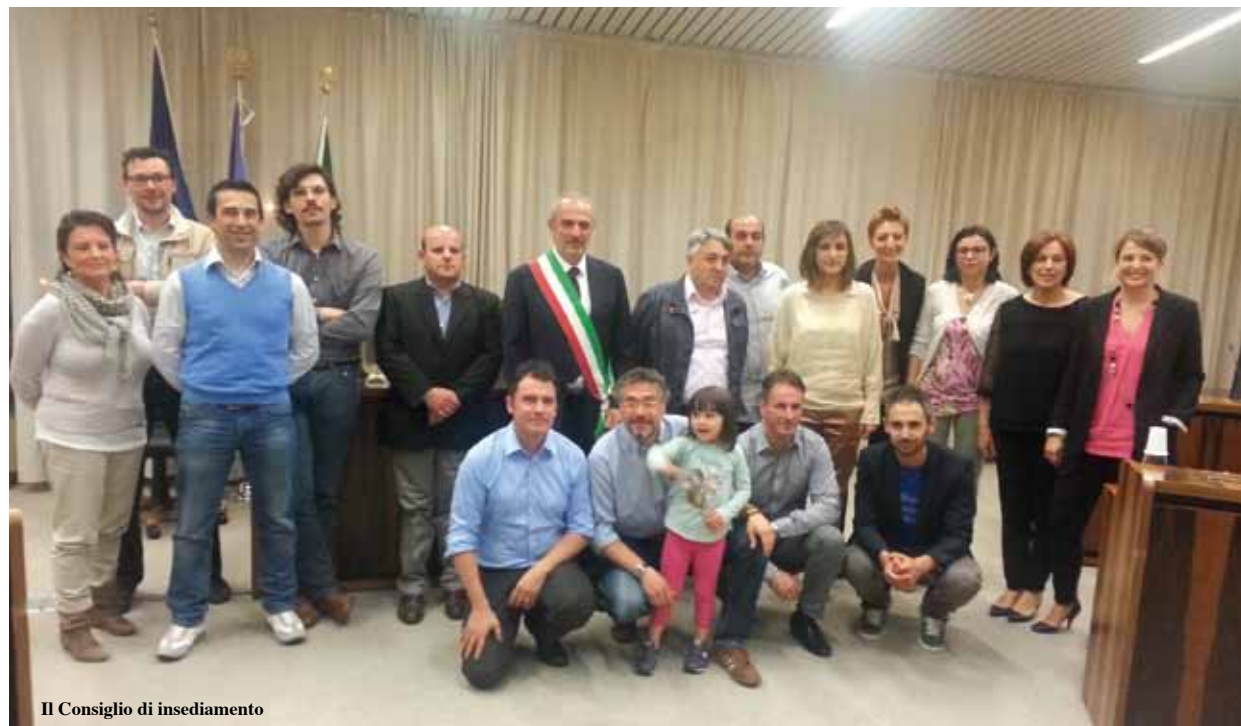
Il Consiglio di insediamento

Non sarà sempre facile, e alla fine il nostro compito sarà quello di sintetizzare e compiere delle scelte, che non possono mai accontentare tutti. Ma le faremo alla luce del sole, evidenziandone ogni aspetto, nel segno di ciò che intendiamo parlando di amministrare un territorio e la sua comunità: una cosa che non può essere delegata a pochi, ma che deve essere impegno condiviso e collettivo ".