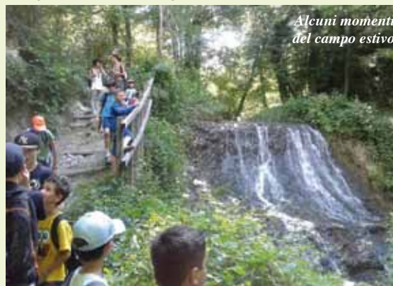
Alcuni momenti del campo estivo

la visita alla Fattoria didattica La Collina dei Cavalli con annesso percorso botanico e, esperienza bellissima per i bambini, conoscenza dei cavalli più anziani ospitati dalla struttura e dei cani Labrador. Nello specifico, con quest'ultima attività, il fine principe è quello di dare cognizione ai bambini del mondo della Pet Teraphy e di come si gestisce il rapporto con il cane, dentro e fuori casa. Un'altra gita sarà da Sweetly, il laboratorio di pasticceria di Cake Design, per divertirsi dando forme e colori a dolci e torte. Le attività sono organizzate dalla cooperativa Creativ e dai suoi