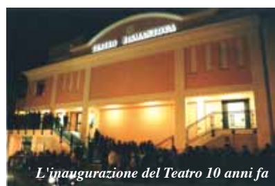
L'inaugurazione del Teatro 10 anni fa

servizi di Protezione civile, il personale, lo Sportello unico per le attività produttive, i servizi informatici, ma sono convinto che saranno molte altre le gestioni associate che potranno essere decise nei prossimi anni. Se il crinale il prossimo 12 ottobre sceglierà di fondersi in un unico Comune, sarà comunque compreso nella nostra Unione, e tutti insieme dovremo garantire una adeguata rappresentanza del territorio nei confronti della Regione e dello Stato, per sostenere i bisogni e le necessità dei nostri cittadini. Castelnuovo dovrà comunque proseguire nel suo ruolo di riferimento comprensoriale, difendendo servizi ornamentali, primo tra tutti l'Ospedale Sant'Anna: l'Amministrazione ed il sottoscritto in questi 10 anni hanno lavorato quasi quotidianamente sul tema della tenuta dell'ospedale e dei servizi sanitari in montagna. Devo dire che tutti i Sindaci della montagna sono sempre stati fortemente impegnati per questo fondamentale presidio, che è un diritto dei nostri cittadini. Abbiamo letto documenti di studio regionale sul possibile riassetto della rete ospedaliera, di fronte ai tagli importanti che la crisi economica ha comportato anche per la sanità pubblica, tuttavia le lungimiranti politiche sanitarie adottate in questi anni da Ausl, Azienda Santa Maria Nuova e Sindaci del nostro territorio, hanno costruito una rete ospedaliera tra il Sant'Anna e lo stesso Santa Maria Nuova, con l'integrazione di molti reparti e servizi che di fatto fanno