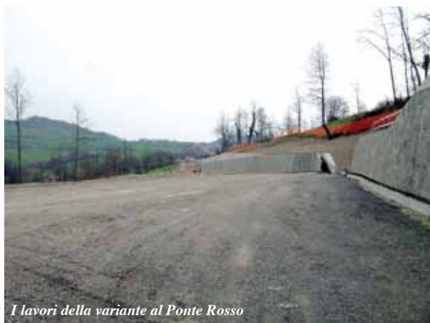
I lavori della variante al Ponte Rosso