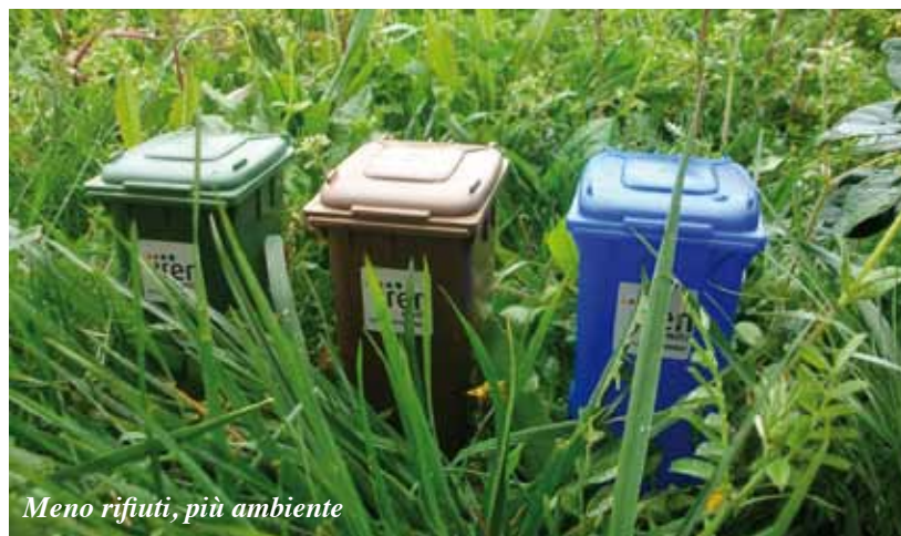
Meno rifiuti, più ambiente

A chiunque sarà il nuovo Sindaco lascio investimenti importanti (dal 2004 al 2014 28 milioni di euro, più la variante del Ponte Rosso e 14 milioni di lavori Anas sulla ss63 da Croce a Ca' del Merlo), materiali ed immateriali, anche grazie alla ricerca di contributi e finanziamenti ed alla partecipazione dei privati ad importanti progetti. Una buona eredità. In termini di indebitamento, negli ultimi anni siamo passati dai 1134 euro pro capite del 2009 a 898 nel 2013, abbiamo ridotto notevolmente il debito legato alla contrazione di mutui, che comunque è stato sempre inferiore alla percentuale sul bilancio di previsione prevista dalla normativa vigente. Lascio una bella squadra di Dirigenti, Operatori, Personale, con cui abbiamo condiviso davvero tanto, nelle gestione delle difficoltà e nei risultati ottenuti. Anche il bilancio di previsione 2014 non sarà certo semplice, come del resto quelli degli ultimi anni, ma sono convinto che con l'impegno, l'ascolto e il coinvolgimento di amministrazione e cittadini usciremo da questa pesante crisi economica e sociale.