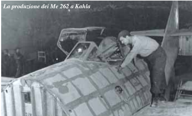
La produzione dei Me 262 a Kahla