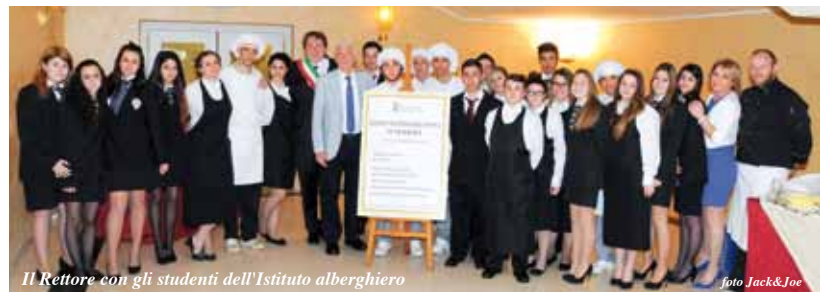
Il Rettore con gli studenti dell'Istituto alberghiero

ca, responsabilità... Ma io ho avuto una grande fortuna che mi ha fatto sentire lieve questo impegno: tanti giovani allievi ai quali ho insegnato con affetto e anche con severità e dai quali in verità ho imparato io stesso tanto. L'entusiasmo di voi giovani, la vostra vivacità, direi a volte la vostra sfrontatezza, sono il motore inesauribile della storia dell'umanità". La lettera completa del Magnifico Rettore è pubblicata sul sito del Comune, www.comune.castelnovo-nemonti.re.it .