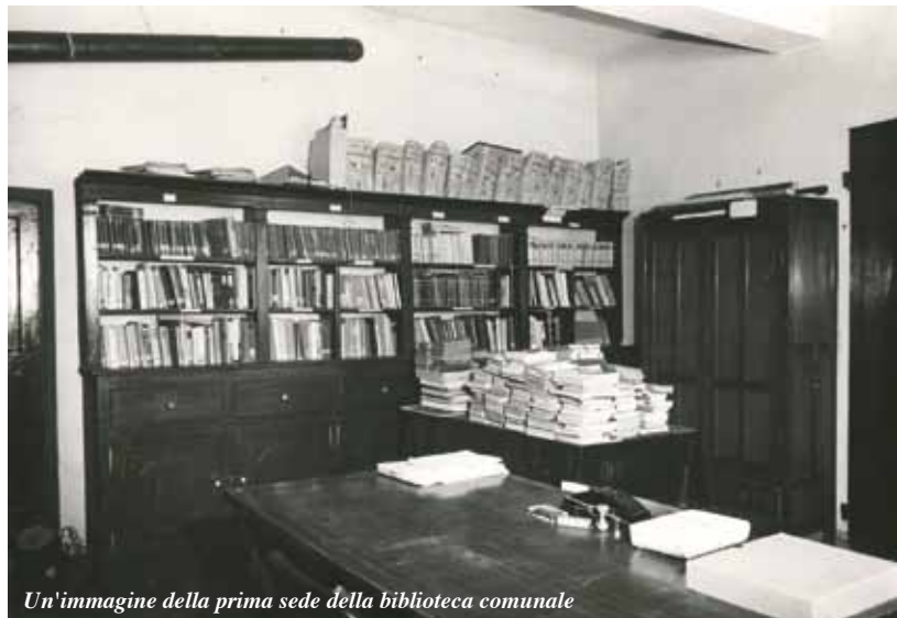
Un'immagine della prima sede della biblioteca comunale