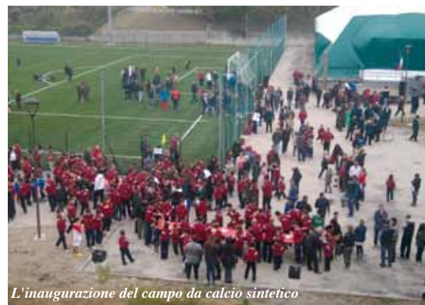
L'inaugurazione del campo da calcio sintetico