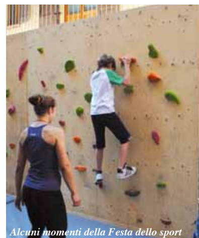
Alcuni momenti della Festa dello sport

l'Onda della Pietra che ad esempio è riconosciuta dalla Regione come palestra etica". La festa del 1° giugno è organizzata dall'Assessorato allo sport in collaborazione con le associazioni sportive e di volontariato del comune: le associazioni sportive organizzeranno dei punti gioco, con le consuete "prove", che riguarderanno la propria attività e disciplina. Ogni partecipante avrà l'occasione di cimentarsi con arrampicata, basket, calcio, danza, ginkana di biciclette, karate, nuoto, sci di fondo, tennis, tennis tavolo, tiro con l'arco, volley, attività motoria per diversamente abili ed altre discipline ancora. Ogni associazione allestirà un proprio stand in cui darà informazioni sulla propria attività ed organizzerà un punto gioco. L'evento si svolgerà nel centro del paese nelle piazze Martiri, Peretti e via Roma chiusi al traffico con l'istituzione dell'isola pedonale dal Grattacielo alla Posta. Animeranno la giornata le esibizioni di Danza Arcobaleno, Centro Danza Appennino, Onda