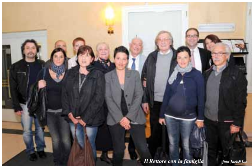
Il Rettore con la famiglia