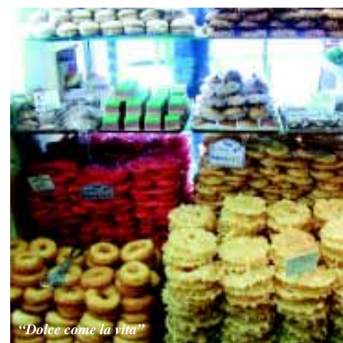
“Dolce come la vita”