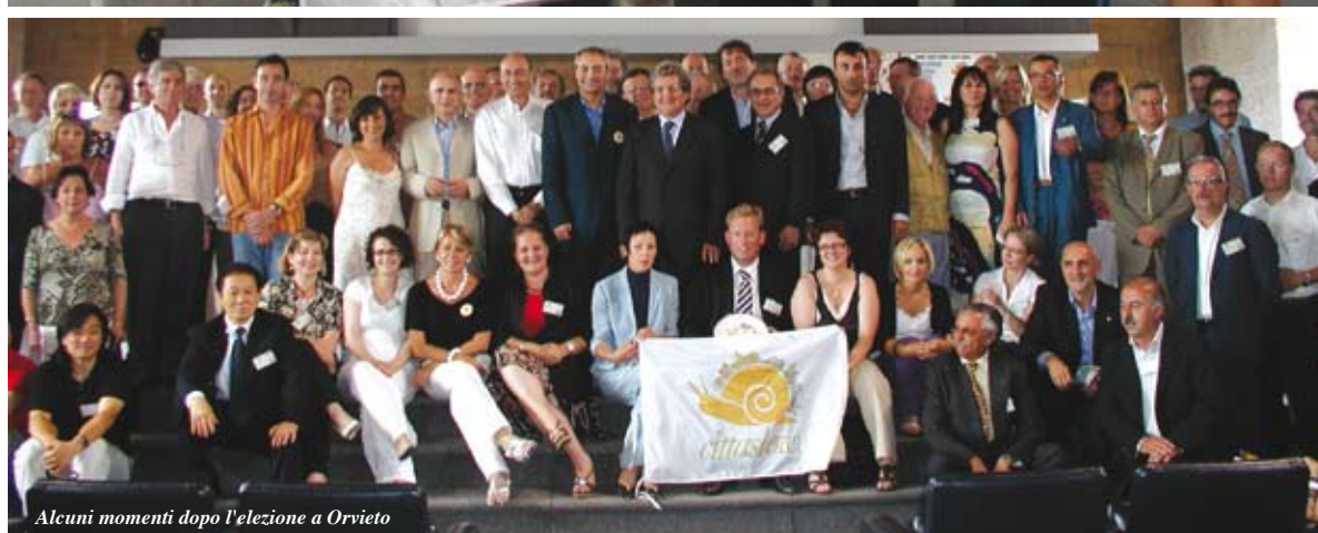
Alcuni momenti dopo l'elezione a Orvieto