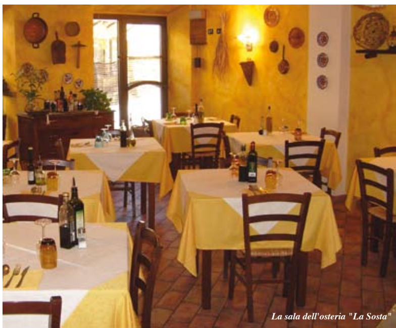
La sala dell'osteria “La Sosta”