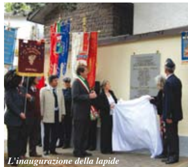
L'inaugurazione della lapide

Lo scorso 15 giugno, con una cerimonia sobria ma carica di significato, Il Comune di Castelnuovo Monti e la sezione di Reggio Emilia dell'Associazione Arma Aeronautica hanno vissuto una importante giornata di commemorazione e ricordo ufficiale degli aviatori caduti, dispersi e decorati dell'Appennino reggiano. L'iniziativa è stata organizzata con