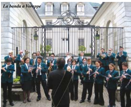
La banda a Voreppe

pe ci è stata data dall'Ufficio cultura di Castelnovo, che ci ha proposto di partecipare al Festival Arsécenic 2008 , una rassegna di musica e teatro che si tiene ogni anno nella cittadina d'oltralpe. Le nostre esibizioni per il festival sono state due: una in "déambulation" per le strade di Voreppe, e un concerto serale in una sala presso la piazza del mercato. Quella delle bande musicali, ci ha spiegato il sindaco Jean Duchamp, è una realtà praticamente scomparsa nei dintorni di Voreppe, perciò la gente del posto non è abituata ad assistere ad esibizioni musicali di organici simili. Sarà per questo che abbiamo riscosso così tanti apprezzamenti per le nostre esibizioni? Emozionanti i momenti di "ritrovo delle radici" nell'ascoltare musiche