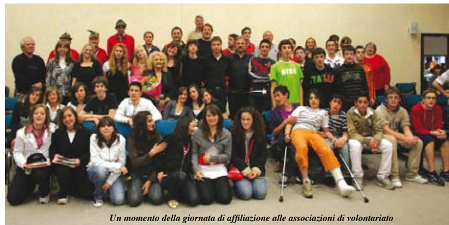
Un momento della giornata di affiliazione alle associazioni di volontariato

te della scuola e far conoscere loro persone che dedicano gratuitamente tempo e lavoro per gli altri: questo è stato il senso profondo del progetto, che ha visto anche un fondamentale dialogo generazionale, basato su una reciproca conoscenza e collaborazione. E' stato un esempio concreto di rete sociale che ha allargato i propri orizzonti dalla famiglia all'intera comunità”.