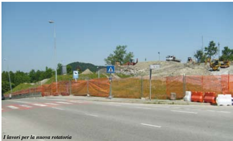
I lavori per la nuova rotatoria

alla rotatoria sarà il nuovo parcheggio a fianco del "Valentino Mazzola", che richiederà l'abbassamento del livello del terreno di un paio di metri. Infine sarà necessario lo spostamento di tutte le reti tecnologiche (gas, acqua, luce, telefono). I tempi stimati prevedono al momento che clima permettendo l'opera sarà conclusa a metà ottobre, ma riteniamo che sarà possibile attivare la circolazione in rotatoria prima dell'avvio del prossimo anno scolastico. Questo obiettivo appare raggiungibile grazie alla collaborazione molto efficace con la ditta appaltatrice e la direzione dei lavori (Unieco e Impresa Romei). Per quanto riguarda il Centro Benessere sono ripresi in questi giorni i lavori che erano stati sospesi a seguito di una revisione del progetto, su richiesta dell'impresa appaltatrice (La Borgonovi attraverso il Consorzio Camar) che ha inserito la realizzazione immediata della vasca esterna, facendone un punto centrale della struttura, più grande ed attrezzata rispetto a quanto previsto inizialmente. L'impresa anche in questo caso si è dichiarata disponibile a realizzare nei tempi più ristretti l'intervento, valutando contemporaneamente l'inserimento di soluzioni alternative volte al risparmio energetico. Nella primavera del 2009 il complesso sarà vicino alla conclusione".