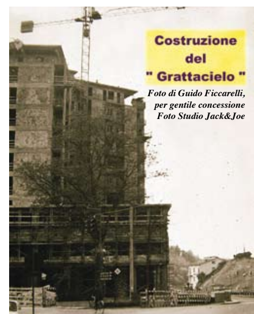
Costruzione del "Grattacielo"

questo tipo erano diverse. C’era comunque molto lavoro: tutta la nostra campagna si serviva qui. Ricordo che il lunedì mattina molti contadini arrivavano con il loro carro carico di grano, legavano le bestie nel cortile e lasciavano carro e grano al mulino