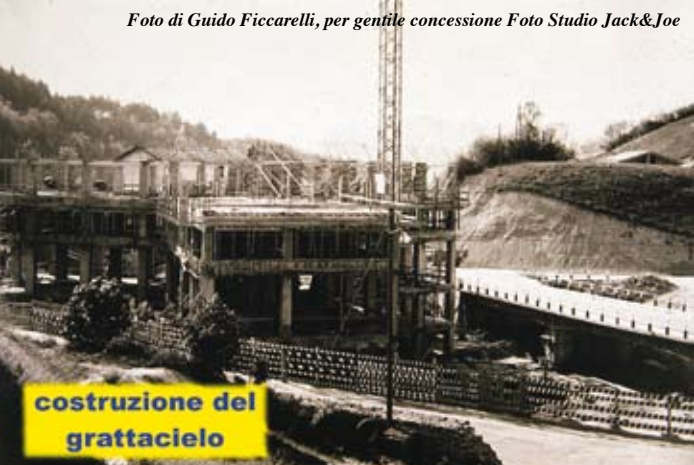
costruzione del grattacielo