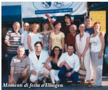
Momenti di festa a Illingen

Anche quest'anno abbiamo partecipato alla annuale festa delle associazioni della comunità gemellata di Illingen, alla fine di giugno. Dopo la partenza da Castelnovo alle 6 del mattino del 27 giugno, con circa 20 partecipanti della montagna,