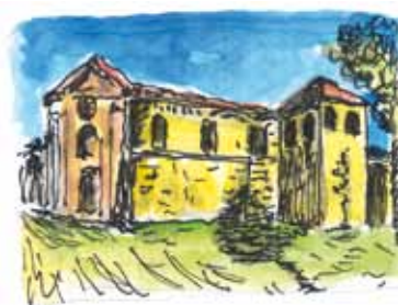
Disegni di Ermano Beretti

Sono i primi che dobbiamo ringraziare, è dalle loro idee e dal loro desiderio di restituire a tutti un poco di questa fonte di ispirazione, che nasce questa grande esperienza. Da contemplare e comprendere con i ritmi ed i tempi giusti, lenti, e con l'apertura di chi voglia abbracciare col pensiero tutto quello che è, che potreb-