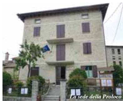
La sede della Proloco

tivo e culturale, mettere al centro la comunità locale e la nostra identità seguendo un modello di sviluppo sostenibile a tutela dell'ambiente per dare ai giovani i motivi per rimanere in montagna. Sono questi gli obiettivi, ambiziosi lo sappiamo, dell'associazione, che abbiamo iniziato a perseguire con le prime attività". E per cercare di raggiungerli la Pro-Loco punterà anche sul simbolo forte della vicina Pietra, "anche attraverso sinergie con altri Enti ed associazioni del territorio. La collaborazione può avere un ruolo strategico per realizzare cose utili per tutti". In campo ci sono già diverse attività già nella stagione estiva, che potete trovare nel calendario com-