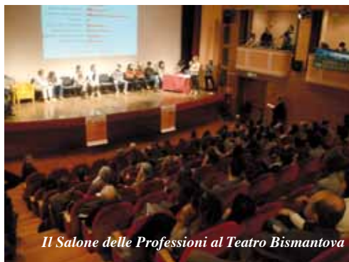
Il Salone delle Professioni al Teatro Bismantova

Castelnuovo si è presentato agli studenti ed alle loro famiglie, inizialmente con una sezione plenaria che ha dato il quadro complessivo dell'offerta formativa appenninica, ed a seguire con degli stand per ogni indirizzo per dettagli più approfonditi, ai quali le famiglie ed i ragazzi hanno avuto la possibilità di accedere per porre domande e richieste. Ci sono poi anche altre attività nella direzione di fornire un migliore orientamento ai ragazzi: ad esempio gli stage orientativi delle scuole superiori, con gli insegnanti